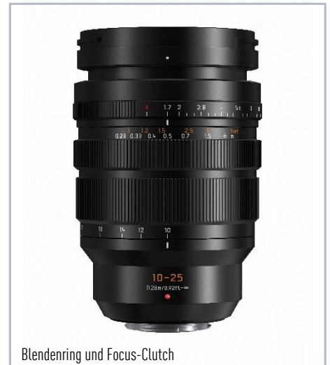
Blendenring und Focus-Clutch