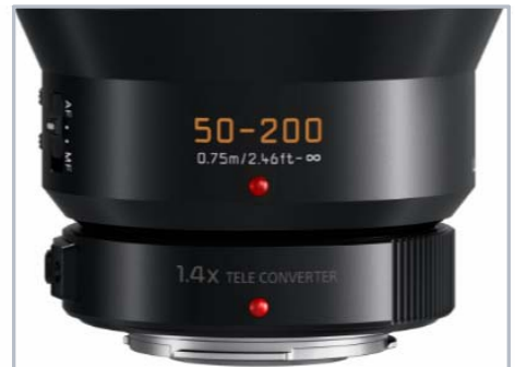
Telekonverter (1,4x und 2,0x) optional