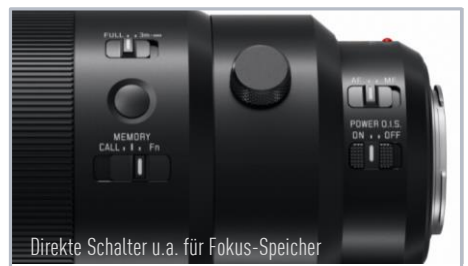
Direkte Schalter u.a. für Fokus-Speicher

Ausgezeichnet mit dem Namen LEICA garantiert dieses außergewöhnliche Teleobjektiv die hohe optische und mechanische Qualität eines Spitzenobjektivs. Das LEICA DG ELMARIT ermöglicht trotz der langen Brennweite von 400mm (KB) eine sehr kompakte Bauweise von nur ca. 17cm, während zugleich Verwacklung, Verzeichnung und chromatische Aberration minimiert werden. Ein mitgelieferter 1,4x-Konverter erweitert die Einsatzmöglichkeiten enorm und bringt die Brennweite auf 560mm (KB) bei Lichtstärke von F4.0.