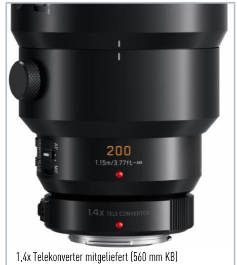
1,4x Telekonverter mitgeliefert (560 mm KB)