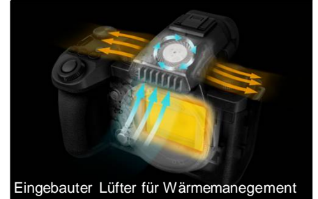
Eingebauter Lüfter für Wärmemanagement

* Body IS und Objektiv IS (sofern im Obj. vorhanden)