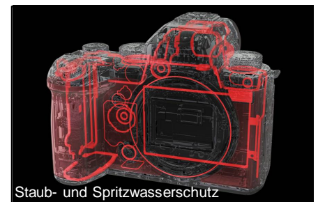
Staub- und Spritzwasserschutz

Mit ihren herausragenden Leistungen im Foto- und Videobereich und einem erstaunlich kompakten und robusten Gehäuse erfüllt die LUMIX DC-S5M2 die hohen Anforderungen von kreativen Foto- und Video-Enthusiasten und bietet gleichzeitig ein außergewöhnliches Preis-Leistungs-Verhältnis.